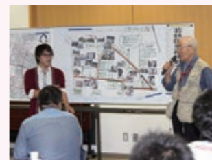
探検の成果を発表します。