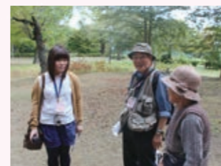
若林の各地域を探検しました。

そのなかで、探検隊の一人ひとりがふるさとの魅力を再発見し、今までよりもっとこのまちが好きになりました。