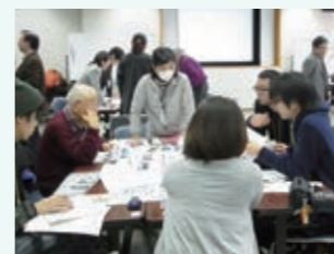
探検の成果を編集します。