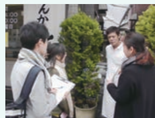
若林の各地域を探検しました。

そのなかで、探検隊の一人ひとりがふるさとの魅力を再発見し、今までよりもっとこのまちが好きになりました。