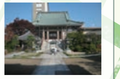
林香院 千支地蔵が並び、樹齢200年のゴヨウマツも