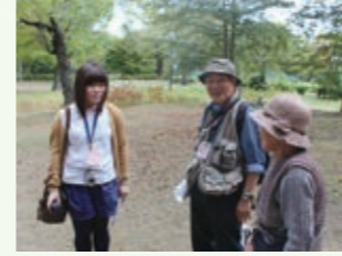
若林の各地域を探検しました。

若林WALKERは、「ふるさと」若林区、の東西線沿線のまちを再発見しよう!、「そして、たくさんの人に東西線に乗って「若林区、に来てもらおう!」との思いで集まった区民が「若林区東西線沿線魅力★探検隊」を結成し、実際にまちを歩き、取材をして作り上げたものです。そのなかで、探検隊の一人ひとりがふるさとの魅力を再発見し、今までよりもっとこのまちが好きになりました。