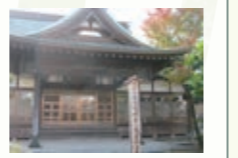
阿弥陀寺 本尊の木造阿弥陀如来立像は県の指定文化財