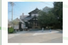
報恩寺 本尊の阿弥陀如来立像は市の指定文化財