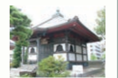
孝勝寺 仙台藩四代藩主伊達綱村が建立した釈迦堂がある