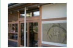
延命餅本舗 屋号は阿弥陀寺の延命地蔵にあやかる