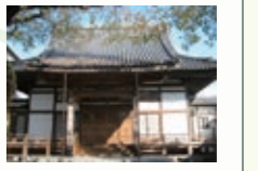
道仁寺 樹齢200年を誇る4本の古木が枝を広げる