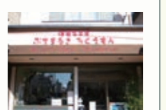
洋菓子工房 ぶちまるき ろくえもん アレルゲンフリーのケーキやパンなどを販売