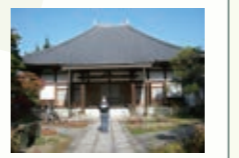
善導寺 境内に豊かに生い茂る木々が印象的