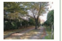
新寺小路緑道 毎月28日には「新寺こみち市」が開催される