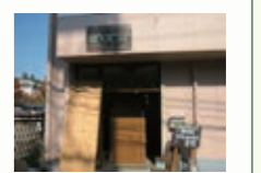
エコロジーショップ energy 自然派食材などのアイテムが豊富