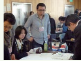
探検の成果を編集します。