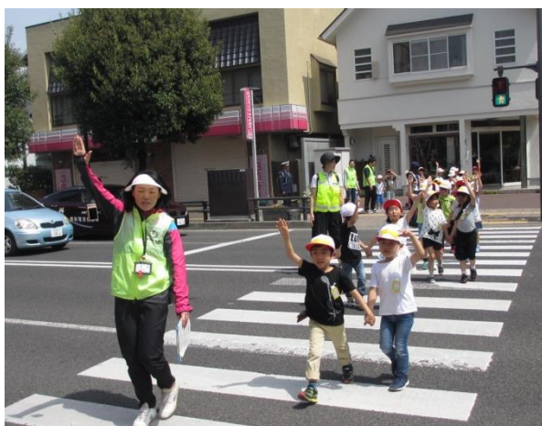
1・2年生の交通安全教室

5・6年生は体育館において、仙台南警察署員のお話とDVDにより、自転車の正しい乗り方を学びました。