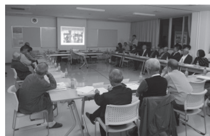
令和元年9月25日（水）18:30～19:10 会場：宮城西市民センター 会議室

三小学校区にお住まいの皆様へ、9月25日（水）に開催された第3回統合準備委員会の様子をお知らせします。