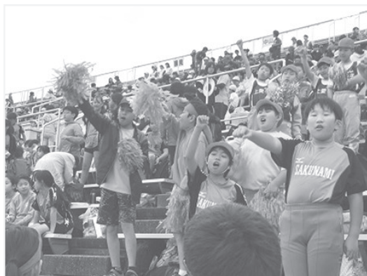
【仙台市陸上記録会の三校応援の様子】

事前交流の様子は、各学校のホームページにも掲載されておりますので、ぜひご覧ください。