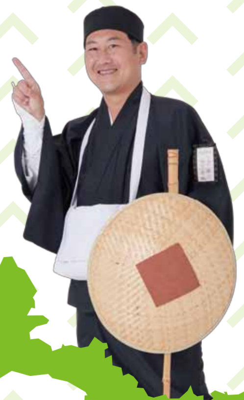
泉崎地区町内会連合会