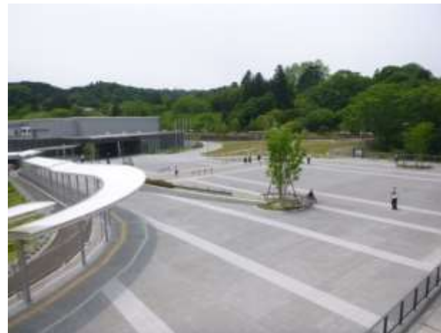
13 国際センター地区 （平成27年度 完成）