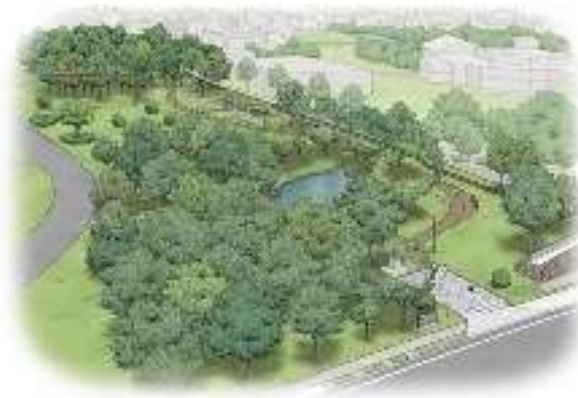
国史跡指定地区 5 二の丸跡 （平成29年度 整備完了）