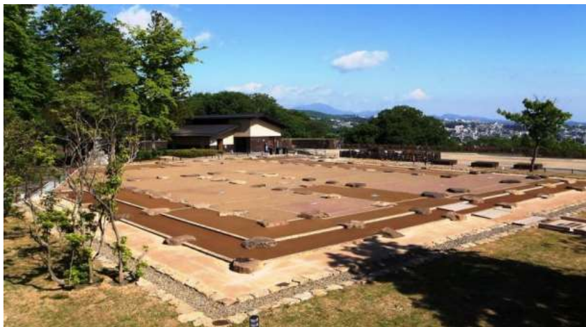
1 国史跡指定地区（本丸広場） （仙台城見聞館と大広間遺構表示）