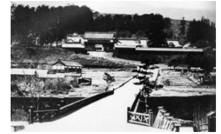
仙台市博物館所蔵