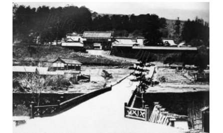
仙台市博物館所蔵