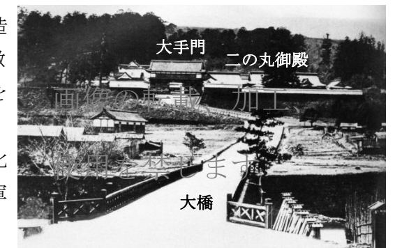
大橋付近からみた明治初期の仙台城跡

このように仙台城跡における眺望は、城郭がもつ歴史的背景と城郭全体の景観とが一体となった「歴史的眺望」として高い価値を有しています。