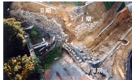
本丸における3時期の石垣

また、城内に残る石垣の特徴にはいくつかの違いが認められます。これは、構築年代の差を示唆する一方で、主に大手道上での視覚的な見栄えの演出や修復の履歴といった城郭の歴史そのものを反映していると考えられることから、仙台城の理解を深める上で高い価値を有しています。