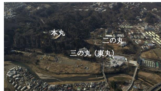
仙台城跡の基本的形状

また、城内には多くの未調査箇所があり、今後の調査によって発見される遺構や遺物についても史跡の本質的価値を構成する重要な要素となります。