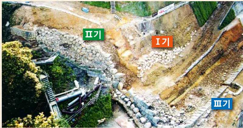
혼마루 북동부 돌담(북동 방면으로)

혼마루 북벽 돌담은 1997년부터 2004년에 걸쳐 수복 공사가 진행되어, 공사에 수반하는 발굴 조사의 결과, 현재 돌담 내부에 시기가 다른 돌담이 2가지 있는 것으로 드러났습니다. 가장 이른 1기 돌담은 다테 마사무네가 축성한 17세기 당시의 것으로, 자연석을 가공하지 않고 길이 방향으로만 쌓는 길이쌓기로 만들어진 것이었습니다. 다음 2기 돌담은 17세기 전반에 축조된 것으로 자연석에 약간 가공을 더해 마구리가 보이는 방향으로 쌓는 마구리쌓기로 만들어졌습니다. 현재의 3기 돌담은 1668년에 일어난 지진 복구 공사로 17세기 후반에 복구된 것이며, 다듬돌을 줄눈을 맞춰 쌓은 것입니다.