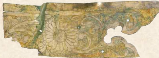
발굴조사로 발견된 금동 장식

「상단의 방」코너에서는 도쿄노마 구석을 실물 크기로 재현하고 있으므로 그 크기와 화려한 장벽화를 꼭 보시기 바랍니다.