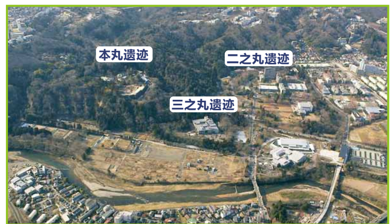
仙台城航空摄影(从东)