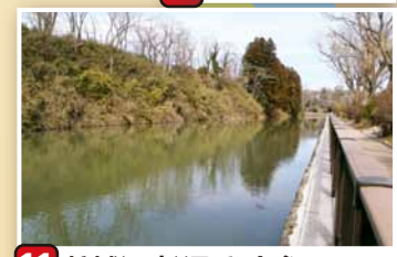
11 护城河(长沼)和土垒