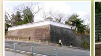
2 大手门北侧土墙(现存建筑物)