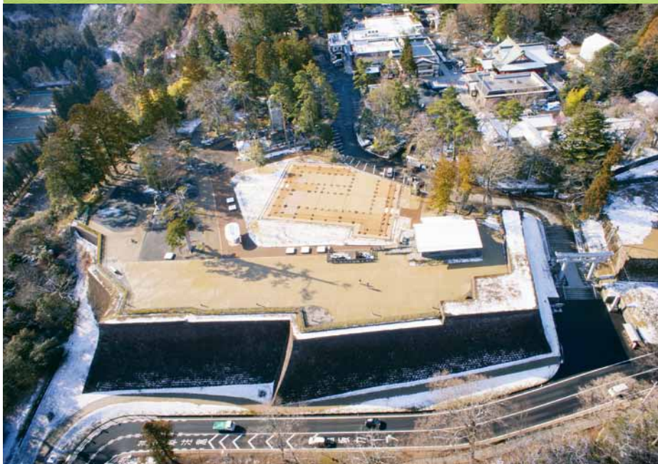
本丸北壁石墙和本丸大广间遗址遗迹表示