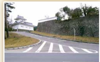
1 大手门遗迹和角望楼(重建)