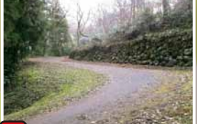
10 弯弯曲曲的登城路