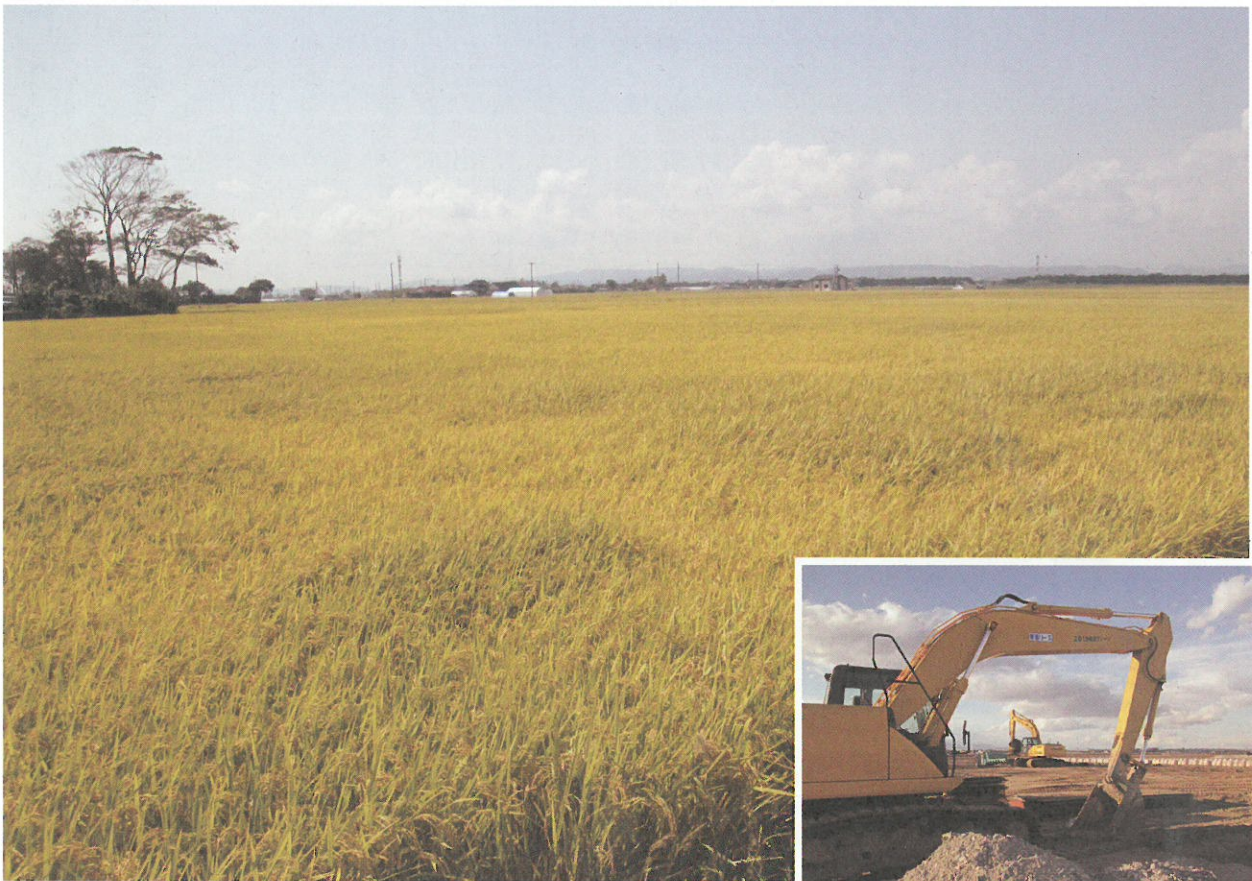
新しく大区画ほ場となった若林区井土地区

仙台市農業委員会 仙台市青葉区国分町三丁目7番1号 TEL 022(214)4308(直通)