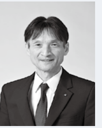
泉区長 遠藤 弘一

泉区は、泉ヶ岳に代表されるように、豊かな自然環境に恵まれ、泉中央地区を中心に文化・商業施設も集まるなど、多様な魅力を併せ持ったまちです。地域の皆さまをはじめ、さまざまな地域団体と連携して、その魅力を発信していくとともに、より一層地域間交流を促進させることで、活力と潤いあふれるまちづくりを進めてまいります。 現在、令和8年度の供用開始に向けて工事を進めている区役所庁舎建替事業では、ユニバーサルデザインや、業務のDX化