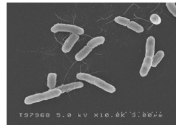
腸管出血性大腸菌 O157