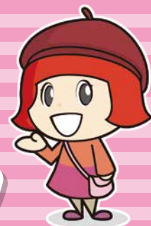
マスコットキャラクター さっち