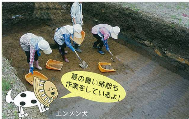
③ 地面をきれいに削って、遺構を探し出します。