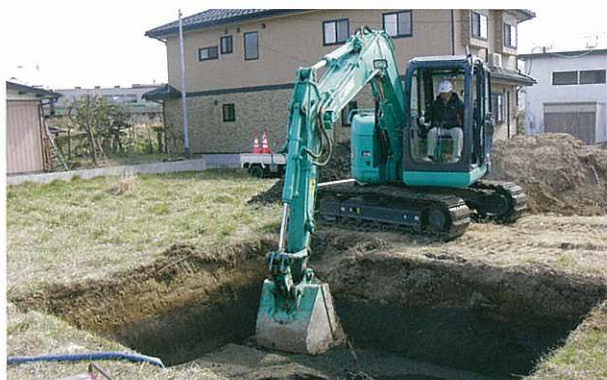
⑥ 調査後は、転圧しながら埋め戻します。

仙台市内には、約780もの遺跡があります。遺跡とは、住居跡などの動かせない生活痕跡である遺構と、道具や器といった動かせる物である遺物が埋まっている場所のことをいいます。