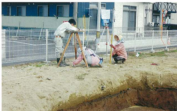
⑤ 測量して図面に記録します。