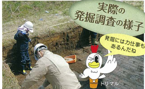
② 壁をスコップできれいにします。