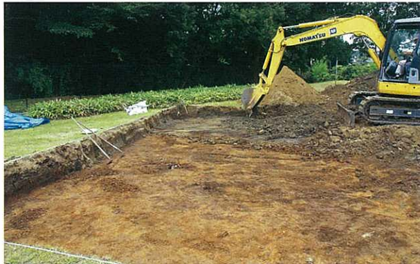
① 重機を使って地表の土や畑の耕作土を除去します。

「発掘調査」と聞くと、土をふるいにかけているところを想像される方が多いのではないのでしょうか。しかし、実際は、スコップを使って少しずつ土の面を削っていき、溝を掘ったりと、大変な作業です。