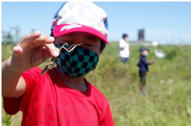
海岸公園に暮らす昆虫を探そう 🐛