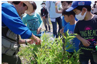
レンジャーと生きものを観察 🍀