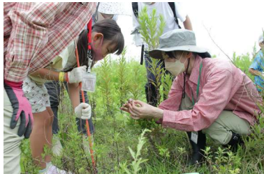
バッタやチョウを探してみよう 🦋🐛