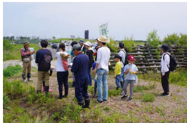
秋の生きものを探してみよう 🍂