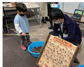
まつぼっくり釣りコーナー

3月5日に仙台国際センターで開催された「仙台防災未来フォーラム2022」に出展しました。活動紹介の展示と、まつぼっくり釣りコーナー、まつぼっくりずかんコーナーを用意し、親子を中心にたくさんの方にお立ち寄りいただきました。こうした機会を通じて活動を知ってもらい、仲間を増やしながらか育樹を進めていきたいと思います。