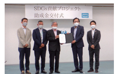
JT東北支社での交付式の様子

2022年の春から夏にかけて、仙台市内の小学生に向けた学習プログラムを実施したり、苗木を育てる圃場を整備します。助成金を大きな励みにして、海岸林の再生と震災の伝承を進めていきます。