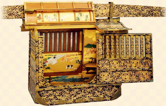
仙台藩主に嫁ぐお姫様の婚礼のためにつくられました 仙台市指定文化財 竹菱梅菱紋時絵女乗物 (部分)