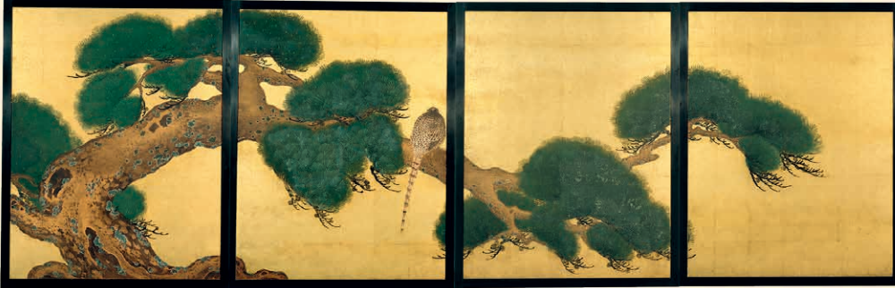
仙台城二の丸松の間のものと伝わる障壁画