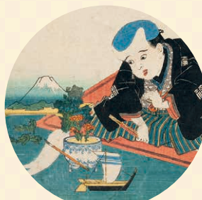
富士山など「福」の「ふ」がつくものが描かれています 有卦絵 (部分) 二代歌川国盛画