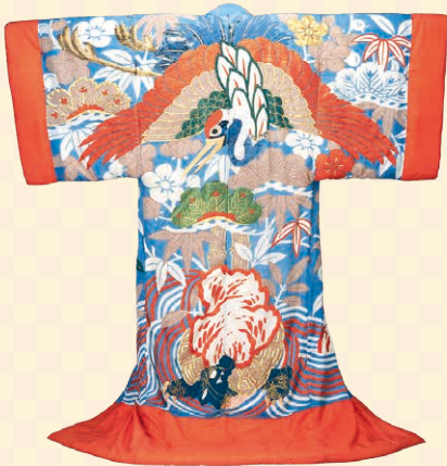
めでたい〇〇がいっぱい! 縹縮緬地松竹梅鶴亀模様夜着