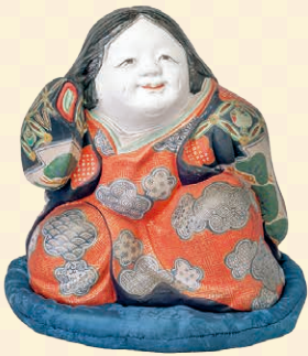
愛嬌ある笑顔のラッキーウーマン 御福置物