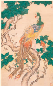
鳳凰ってなに者? 桐に鳳凰図 小池曲江筆