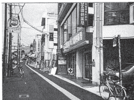
宮城野原駅あたりに並ぶ調剤薬局

20数年前宮城野3丁目に住んでいて、よく仙石線を利用して街に出掛けていた。宮城野原駅のすぐそばのスーパーで買い物をしたり、その向かい側のケーキ屋さんやクリーニング屋さんなども利用した。東街道踏切を渡ると育英高校で、学生が（男子だけ）黒い制服でかたまって来るのでちょっと恐ろしく思えた（今だと違うのに、若かったから？）。飲食店、花屋、果物屋などがわりとあって、日中から夕方にかけてはにぎやかな街だったが、夜8時ころになると人通りも少なくなり店も閉まって車もさほど通らなくなりひとりで駅から家に帰るのが嫌だった。バスは走っていたがあまり乗