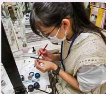
ネイルのチップ作り MODE COLLECTION(柳生中)