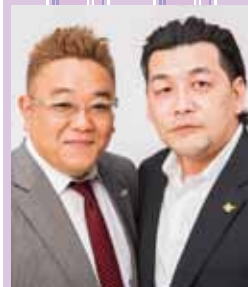
お笑い芸人 サンドウィッチマン さん