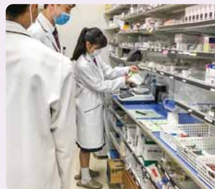
袋詰め体験 マリン調剤薬局 BRANCH 仙台店(桜丘中)