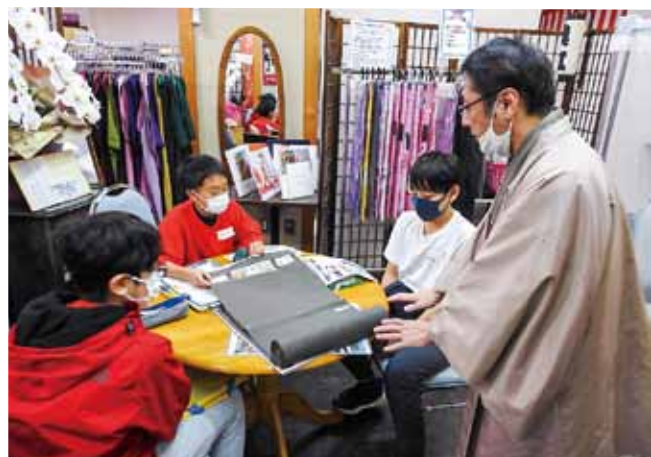
奥江呉服店【荒町小】