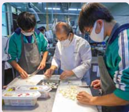
料理の下ごしらえ レストラン シェヌー(中野中)