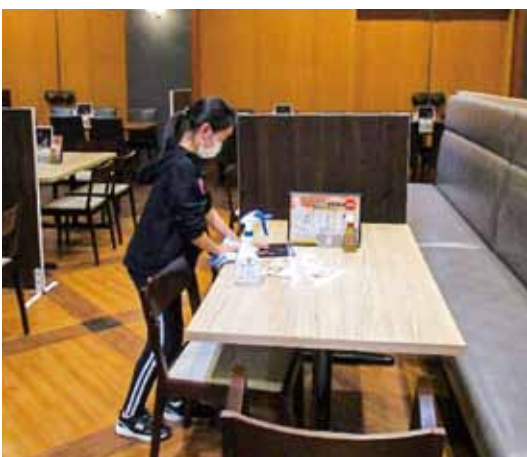
ホテル瑞鳳【馬場小】

小学校でも職場体験活動を行っている学校があります。実際に体験をすることによって、仕事・働くことについての理解を深めました。