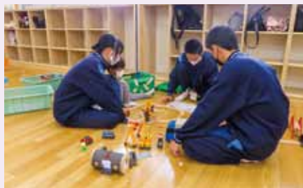
西多賀児童館（西多賀中）