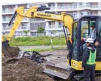
赤坂建設株式会社

現場や企業の実際に触れ、専門的な知識・技術・技能を実践的、体験的に習得し、地域産業に貢献できる人材を育成することを目的に、2年生でインターンシップ(職場体験)、3年生でデュアルシステム(企業実習)を行っています。