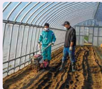
土の掘り起こし 中里農園(高砂中)