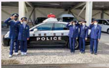
仙台東警察署（中野中）