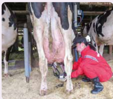
搾乳のようす HAPPY FARM 庄司牧場(根白石中)

子どもの健全な育成に、大人の果たす役割は大きいものです。 「子育て」「人づくり」を社会全体で一緒に取り組みましょう。ご協力をお願いいたします！