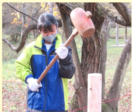
太白山自然観察センター(人来田中)