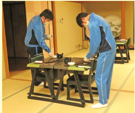
秋保リゾートホテルクレセント(秋保中)