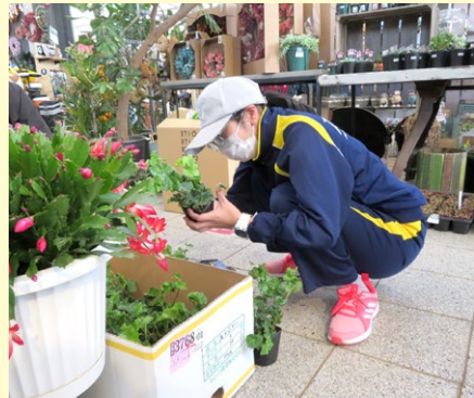
ガーデンガーデン(広陵中)