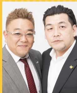
お笑い芸人 サンドウィッチマン さん