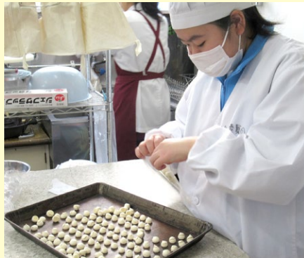
ローザス洋菓子店(南小泉中)

子どもの健全な育成に、大人の果たす役割は大きいものです。 「子育て」「人づくり」を社会全体で一緒に取り組みましょう。ご協力をお願いいたします!