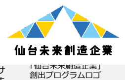
「仙台未来創造企業創出プログラム」創出プログラムロゴ

本市企業の海外市場開拓を支援するため、オンラインセミナーやオンライン商談会、仙台-タイ経済交流サポートデスクによるテストマーケティング出張の代行、ジェトロ海外拠点などの利活用促進に取り組めます。