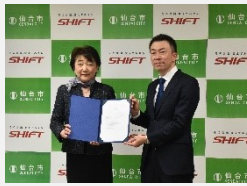
進出企業による立地表明式