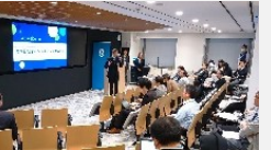
第6回ヘルステックMeetupの様子