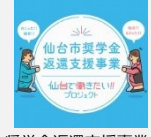
奨学金返還支援事業