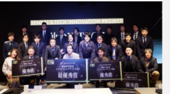
X-TECHイノベーションアワードの様子

仙台蒲生産業団地について、市有地利活用の候補事業者の契約手続き等を円滑に実施し、当団地全体に産業集積を図ります。また、震災前の水準以上に回復した仙台港区のコンテナ取扱量のさらなる増加を目指し、官民一体となった枠組みによって各種事業を実施します。