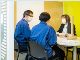
中小企業応援窓口

「仙台テレワークサポートデスク」を通じて、テレワーク導入を支援することにより、中小企業の「新しい生活様式」を踏まえた新たなビジネススタイルを支援します。ICT活用による地域企業のデジタル化を推進し、新たな市場の開拓や生産性向上などによる経営力強化に向けて、専門家による伴走支援やセミナー、地元ICT関連企業とのマッチング等を行います。