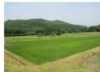
集落内の共同活動で保全されている農地（青葉区大倉地区）

林業の生産基盤の整備や適正な維持管理を行うことにより、生産性や森林の経済価値の向上を図ります。