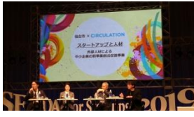
外部人材による中小企業の新事業創出促進事業 H30成果報告会