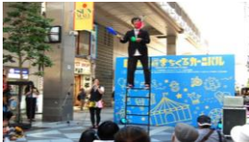
中心部商店街活性化イベント 「まちくるカーニバル」(2018年)