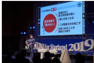
起業家応援イベント 「SENDAI for Startups!」

起業に関するワンストップ相談対応や各種セミナー開催に加え、既存企業経営者による実践性の高い支援を行い、起業後の存続率向上と成長を促進します。