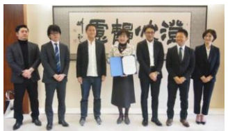
進出企業による立地表明式