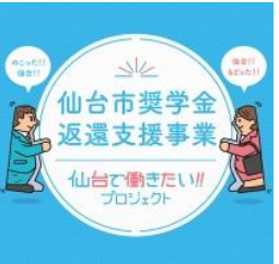
奨学金返還支援事業