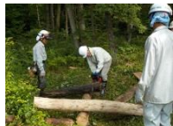
森林ドバィザン養成講座の様子