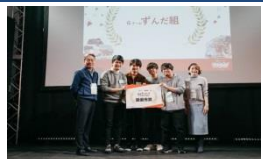
仙台市x楽天イーグルス エンターテックアイデアソン

介護現場のニーズ調査、製品・サービスの開発・実証、及び導入・定着に取り組み、ICT活用による介護現場の労働負担軽減・生産性向上や、ICT企業の介護分野への事業展開を支援します。