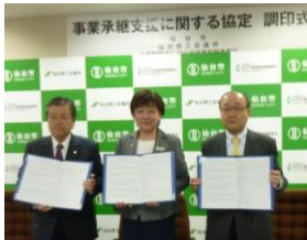
仙台商工会議所・本市産業振興事業団 との事業承継支援に関する協定

商店街組織の枠を越えて連携するエリアマネジメント組織の活動を支援するとともに、中心部商店街エリアへの来街機会向上に向けたイベントの開催や、来街者の属性や来街目的等の調査を実施します。