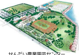
せんたい農業園芸センター

民間事業者が運営するせんたい農業園芸センターについて、関連事業への補助等を行い、農業者等の人材育成及び市民が農と触れ合える拠点施設としての活用を進めます。