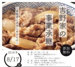
事業承継セミナー

商店街組織の枠を越えて連携するエリアマネジメント組織の活動を支援するとともに、中心部商店街エリアへの来街機会向上に向けたイベントの開催や、来街者の属性や来街目的等の調査を実施する。