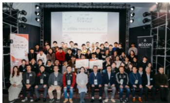
エンターテック・アイデアソン

介護現場のニーズ調査、製品・サービスの開発・実証、および導入・定着に取り組む、ICT活用による介護現場の労働負担軽減・生産性向上や、地域ICT企業の介護分野への事業展開を支援する。