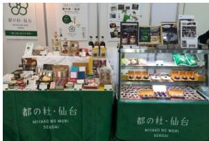
地域ブランド構築事業