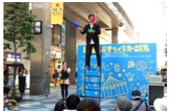
まちくるカーニバル