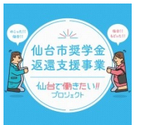
奨学金返還支援事業

仙台「四方よし」企業大賞 Sendai "Shihayoshi" Corporate Award