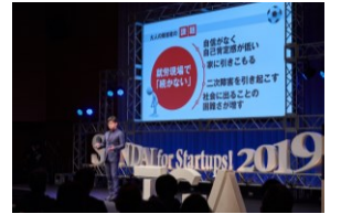
起業家応援イベント 「SENDAI for Startups!」

起業に関するワンストップ相談対応や各種セミナー開催に加え、モニター協力者や既存企業経営者による実践性の高い支援を行い、起業後の存続率向上と成長を促進する。