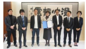
進出企業による立地表明式