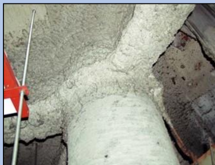
吹付けアスベスト