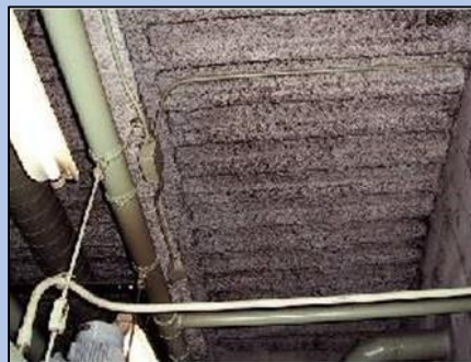
アスベスト含有吹付ロックウール