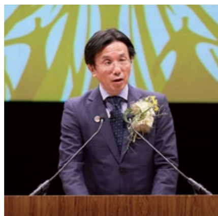
国土交通省大臣官房審議官 五十嵐 康之氏