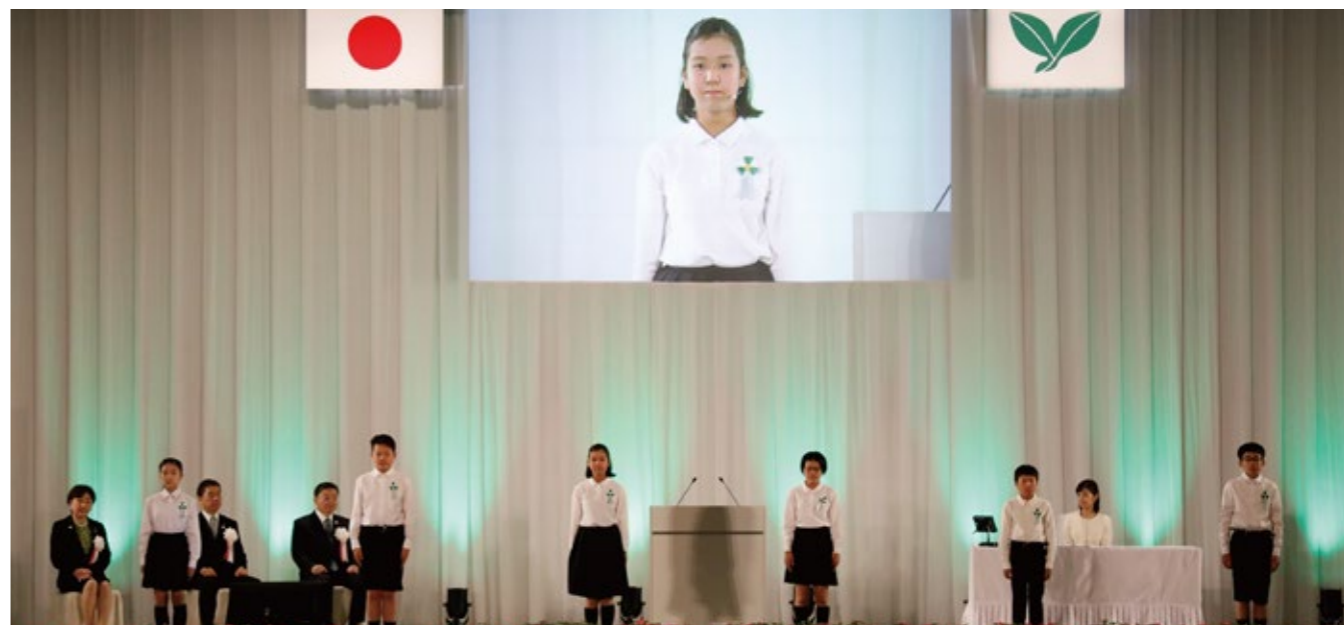
仙台市立上杉山通小学校 児童6名