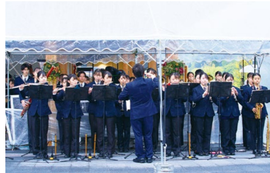
聖ウルスラ学院英智高等学校吹奏楽部によるパフォーマンス