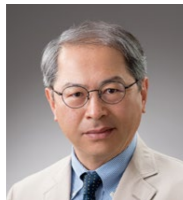
第40回全国都市緑化仙台フェア 実行委員会副会長

結びに、第40回全国都市緑化仙台フェア「未来の杜せんだい2023」の開催にあたり、実行委員会の皆様をはじめ、お力添えを賜りました全ての皆様に、厚く御礼申し上げます。