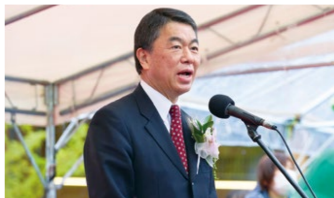
実行委員会顧問 宮城県知事 村井 嘉浩氏