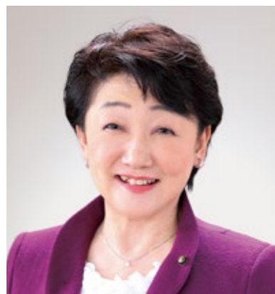
第40回全国都市緑化仙台フェア 実行委員会会長