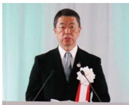
宮城県知事 村井 嘉浩氏