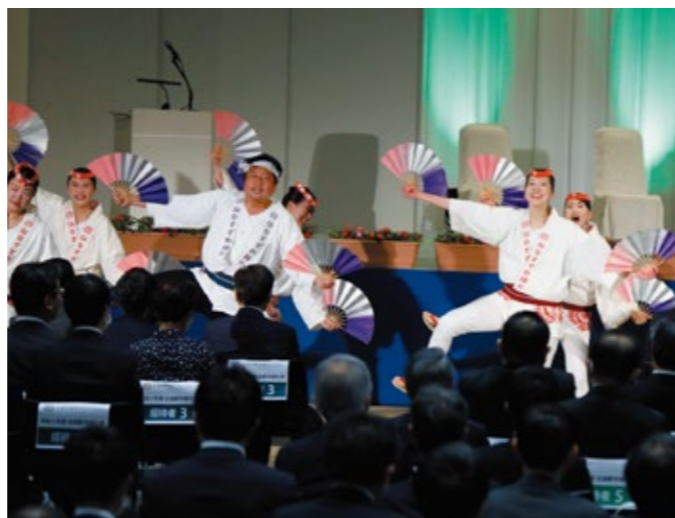
「伊達の舞」による仙台すずめ踊り