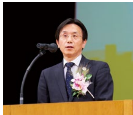
国土交通省大臣官房審議官 五十嵐 康之氏