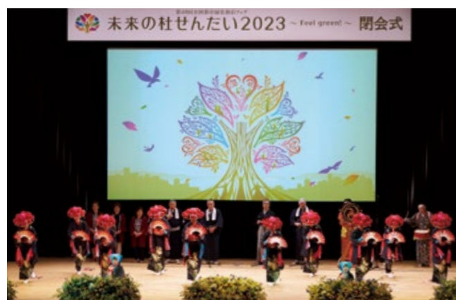
長袋の田植踊保存会による秋保の田植踊