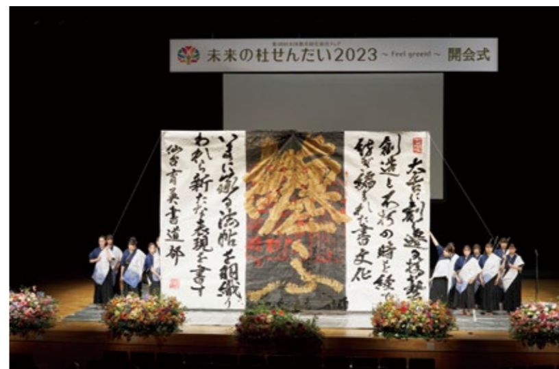
仙台育英学園高等学校書道部によるパフォーマンス