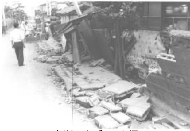
倒壊したブロック塀