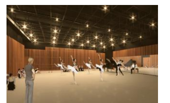
クリエイティブスタジオ