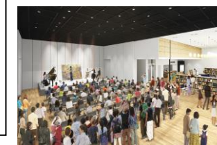
文化芸術交流センター・コート