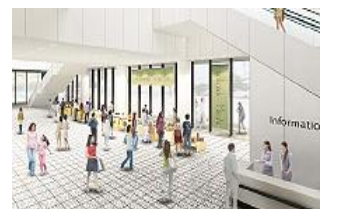
文化芸術交流センター・モール