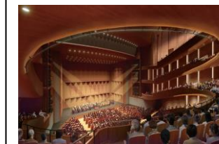
札幌文化芸術劇場