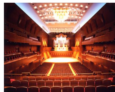
コンサートホール

敷地面積： 約 6,905 ㎡ 建築面積： 約 6,161 ㎡ 延床面積： 約 27,805 ㎡