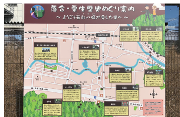
▲JR陸前落合駅前の総合案内板

次年度以降は「地域めぐり総合案内板」に掲載された案内場所を詳しく説明するためのリーフレットを作成し、歴史案内ボランティアとして成長した会員が、設置した案内板はもとより地域の歴史や史跡のガイドをしながら地域の歴史的魅力を地域内外に発信する活動を続けていきます。