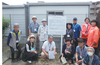
▲第六天堂・道祖神堂・地藏堂の案内板

地域の史跡に案内板を設置したことにより、現地・チラシ・ポスター等で、地域内外の市民に落合栗生の歴史文化を周知することができました。JR陸前落合駅前に設置した総合案内板は、さらに多くの市民に落合栗生地地域の史跡と歴史を紹介することになります。受講生それぞれの意見を抽出し一つにまとめることは大変難しい作業でしたが、その分、みなさんの思いや意欲を十分に汲んだ案内板を完成することが出来